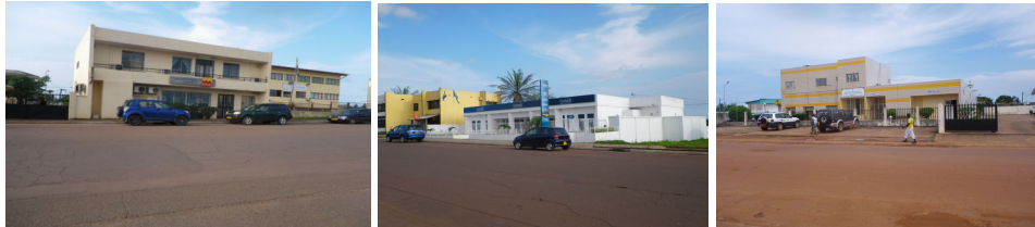
UGB – Ecobank – La Poste à Oyem

Deux compagnies d'assurance sont représentées dans la province : AXA et OGAR.