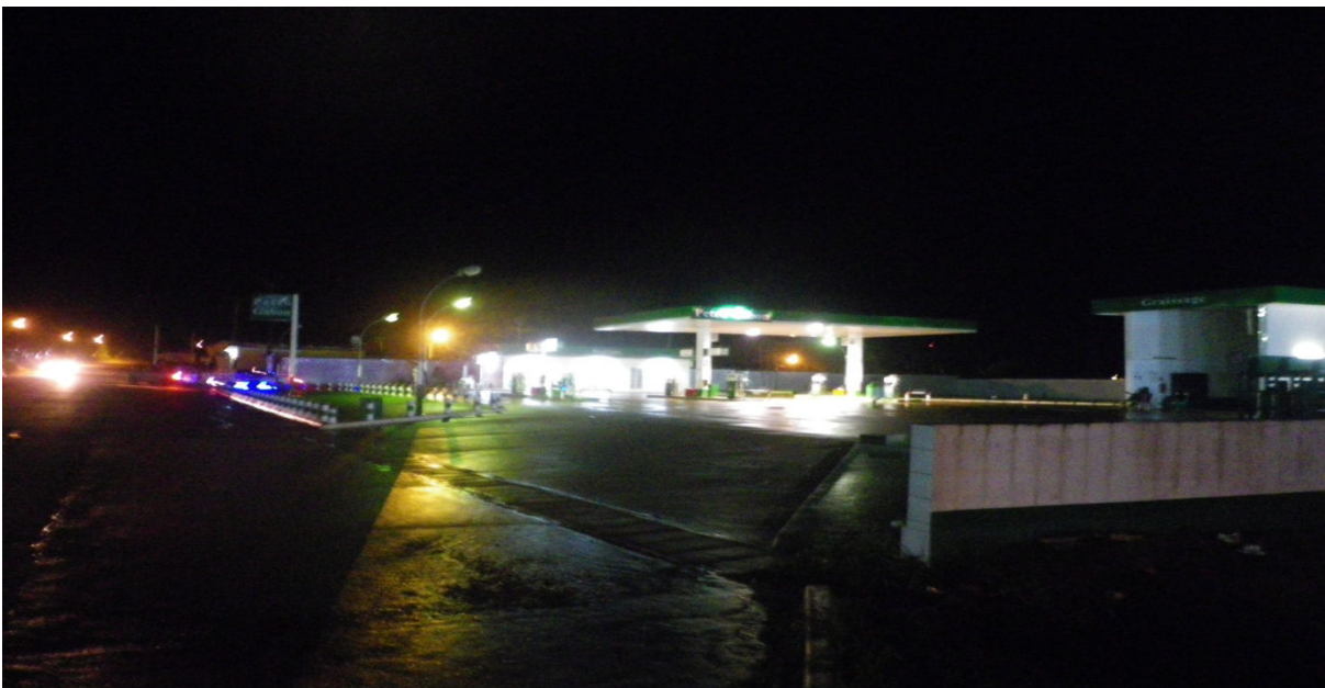
Station service à Oyem

Le chiffre d'affaires réalisé par les distributeurs des produits pétroliers est passé de 3 175 millions de F CFA en 2013 à 3 984 millions de F CFA en 2014, soit une hausse de 25,5% en liaison avec l'amélioration des activités économiques dans la province.