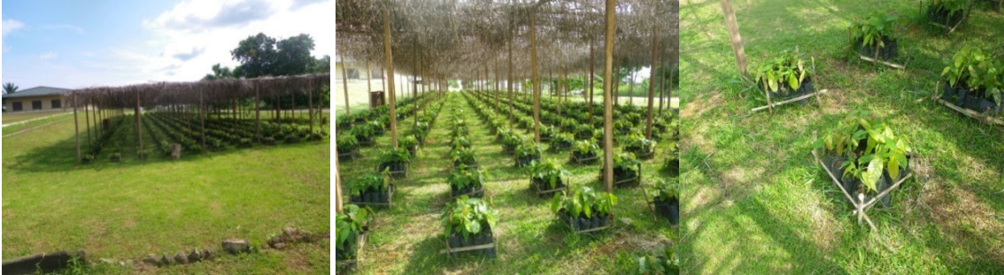
Pépinières de cacaoyers à Oyem