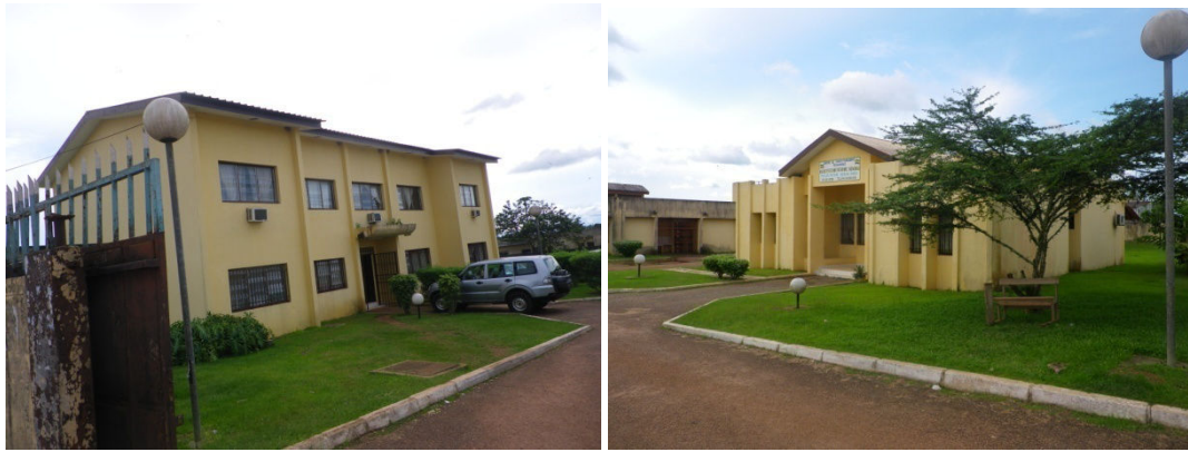
Direction de l'Académie Provinciale à Oyem