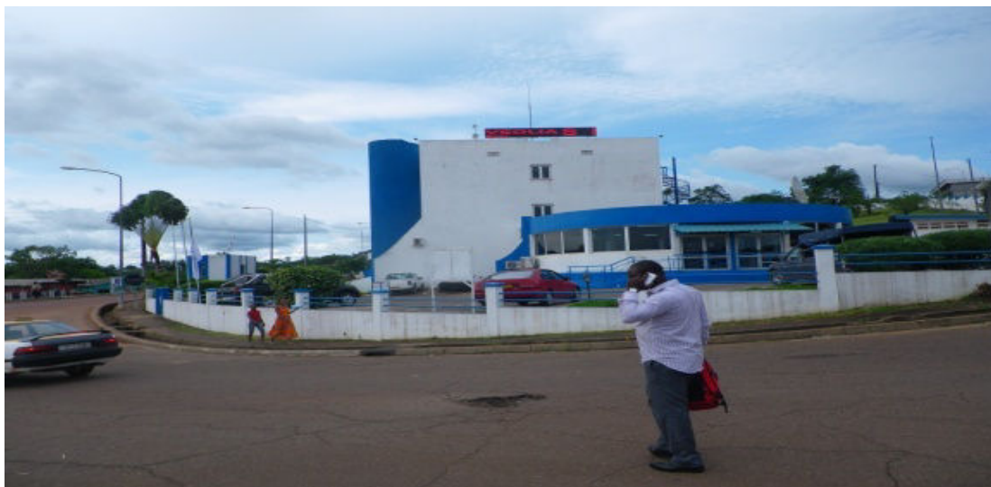
Siège de la SEEG à Oyem