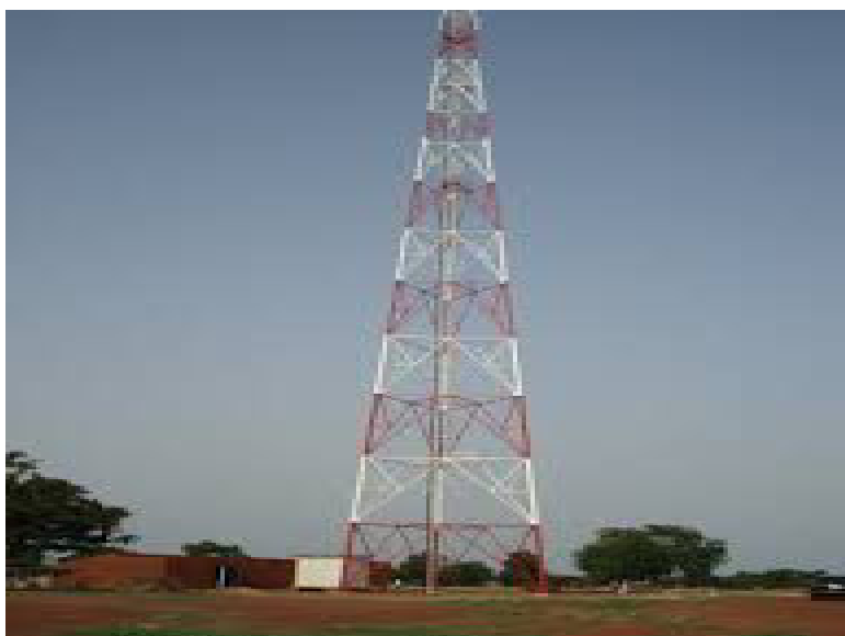
Pylône d'un opérateur de téléphonie mobile