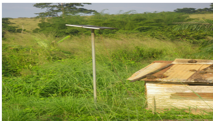
Panneau solaire dans un village entre Tchibanga et Mayumba