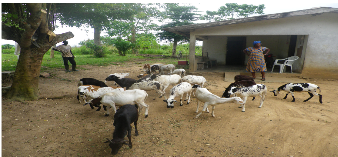
Troupeau de moutons du CATE

Le C ATE gère un cheptel de 30 moutons en 2013.