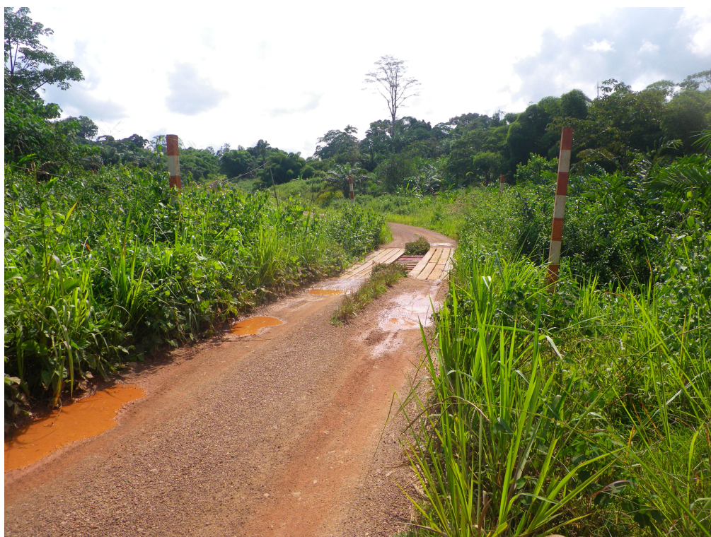
Tronçon de route Tchibanga - Moabi

Le reste du réseau routier est composé de routes non classées et de routes créées par les opérateurs du secteur bois, appelées routes forestières.