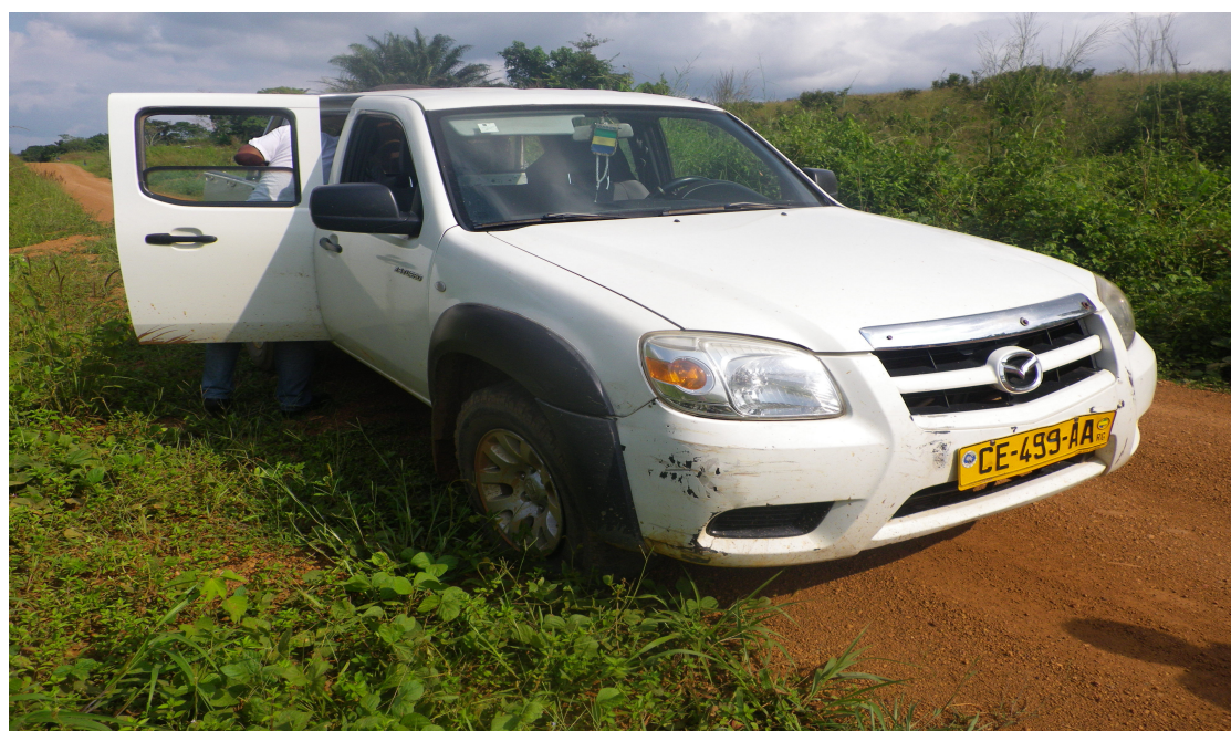
Transporteur routier sur la route de Moulengui-Binza

Le souci d'encadrer et de canaliser les voyageurs a emmené certaines personnes à organiser le transport routier à Tchibanga. Cette organisation se présente sous forme d'agences de voyages. Le personnel de ces agences est chargé de l'enregistrement des clients et leurs bagages, de l'embarquement des clients en toute sécurité selon l'ordre d'arrivée et selon leur destination.