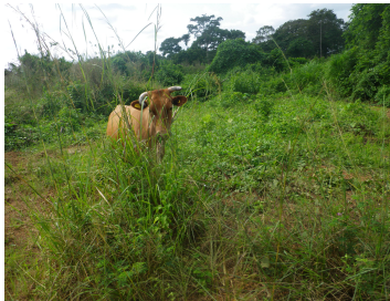
Ranch SIAT Gabon