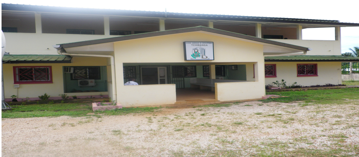
Image 16 : Agence de la Banque Gabonaise de Développement à Tchibanga

La BGD emploie 9 agents et, est organisée en trois services : recouvrement, commercial et comptabilité.