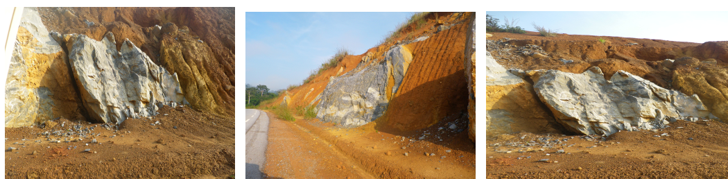
Quelques blocs de marbre sur la route Tchibanga - Mayumba