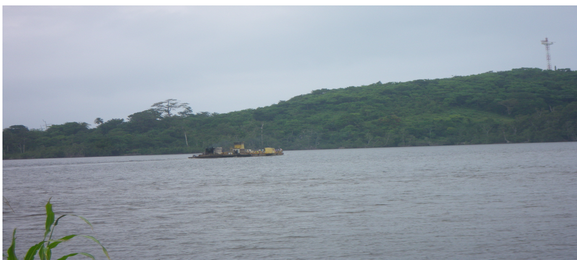
Bac traversant la lagune Banio

La pirogue est le moyen de transport utilisé pour accéder au département de la Haute Banio qui a pour capitale Ndindi. Cette activité essentiellement exercé par les nationaux n'est pas encore organisée. En attendant la livraison du pont sur la Banio, sa traversée s'effectue également par le bac gratuitement pour accéder à Mayumba.