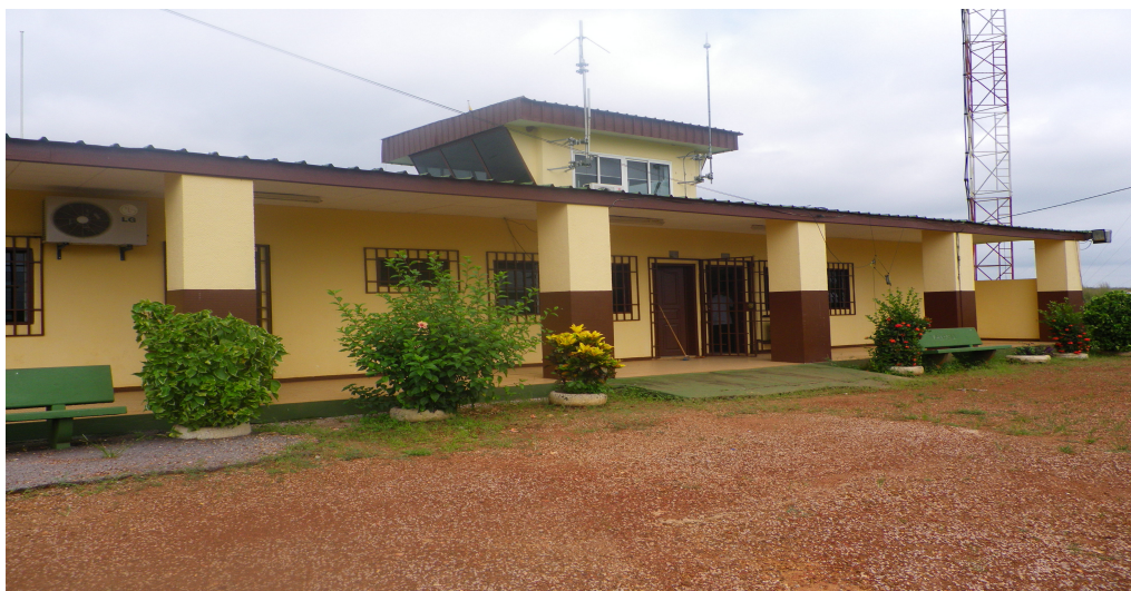
Aéroport de Tchibanga

La province de la Nyanga compte trois aérodromes. Pour l'heure, seul celui de Tchibanga, d'un linéaire de 2 000 mètres de piste et en bon état, est exploité. En revanche, ceux de Moabi et Mayumba (1 800 mètres de piste) sont utilisés en affrètement. L'insuffisance des passagers liée au départ des forestiers dans ces deux localités est la raison de l'abandon de ces pistes d'atterrissage.