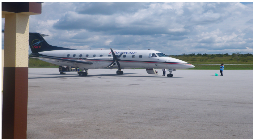
Avion de la compagnie National Régional Transport