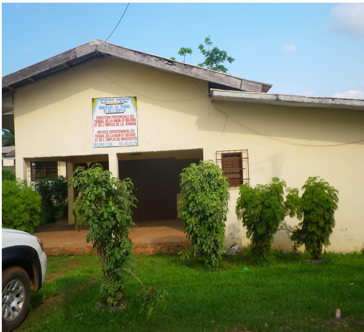
Direction Provinciale du Travail

Le manque de statistiques ne permet pas de bien cerner le niveau de l'emploi dans le secteur privé. Le secteur bois et industries du bois, jadis premier employeur de la province ne vient désormais qu'en troisième position après les BTP et la pêche. Toutefois, en 2013 ce secteur a connu une hausse non négligeable de ses effectifs (+52,82%).