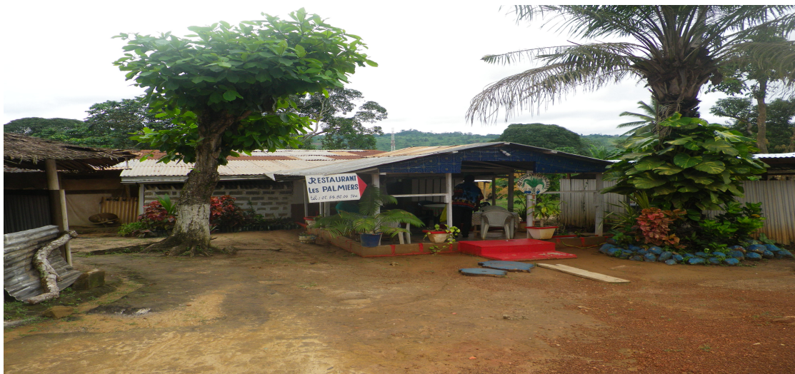
Restaurant les palmiers de Tchibanga