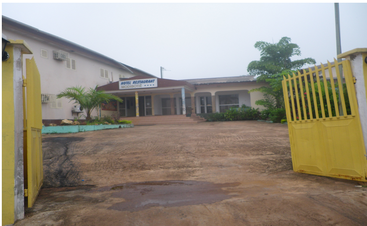
Hôtel MODIBITIE de Tchibanga

L'activité des hôtels connaît des saisons hautes et basses. Les événements ponctuels (élections, fêtes et cérémonies diverses) constituent des périodes de fortes affluences pendant lesquelles le taux d'occupation est élevé. En périodes basses ce taux se situe à 30% en moyenne.